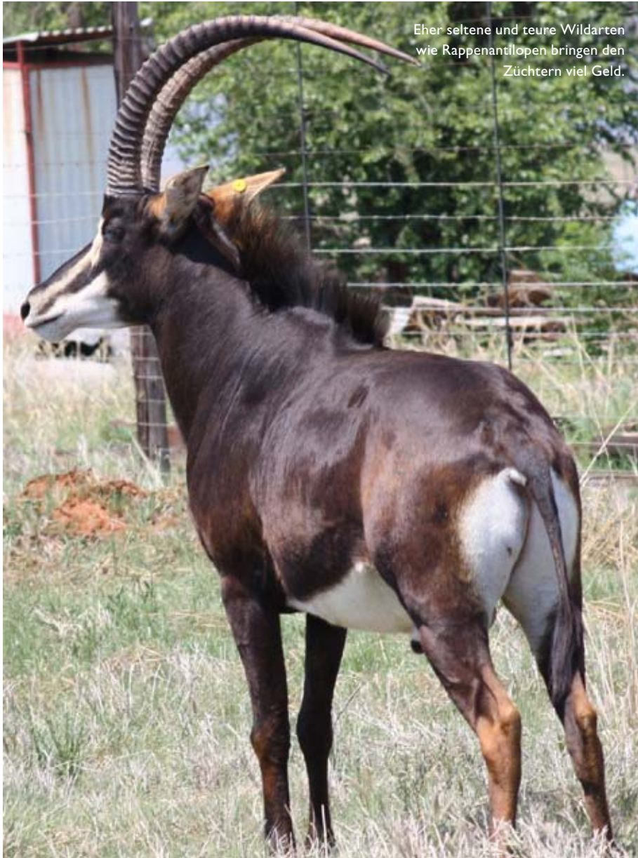
Eher seltene und teure Wildarten wie Rappenantilopen bringen den Züchtern viel Geld.

Hörner zu erzielen: gezielte Kreuzungen, Gentests, künstliche Befruchtung, Hormone, Embryonentransfer usw.