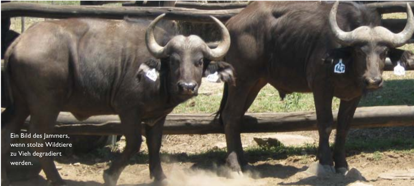
Ein Bild des Jammers, wenn stolze Wildtiere zu Vieh degradiert werden.

tika von Arten (z. B. Pelzfarbe, Körperform, Größe von Horn oder Geweih), und zwar insbesondere wenn dies durch Folgendes geschieht: