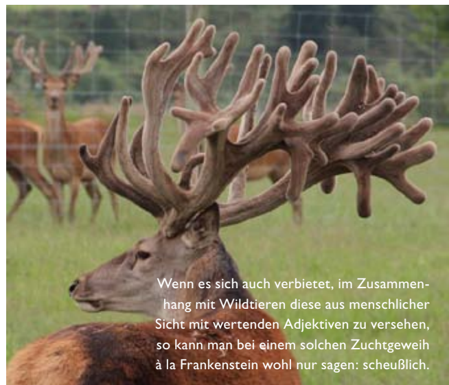
Wenn es sich auch verbietet, im Zusammenhang mit Wildtieren diese aus menschlicher Sicht mit wertenden Adjektiven zu versehen, so kann man bei einem solchen Zuchtgeweih à la Frankenstein wohl nur sagen: scheußlich.