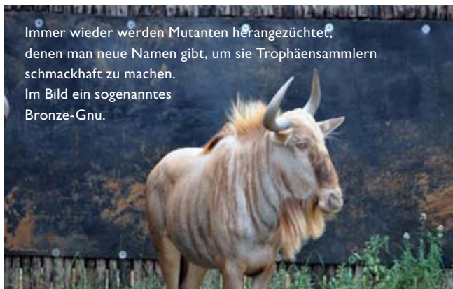
Immer wieder werden Mutanten herangezüchtet, denen man neue Namen gibt, um sie Trophäensammlern schmackhaft zu machen. Im Bild ein sogenanntes Bronze-Gnu.

Vor zwanzig Jahren begleitete ich einen Freund in ein Jagdgut in Österreich. Wir wussten, dass es ein Gatter war, hatten aber – ich schwöre es – keine Ahnung, dass wir in einem jagdlichen Bordellbetrieb landen würden. In unserer Naivität wussten wir noch nicht einmal, dass es Kleingatter zum Totschießen speziell für diesen Zweck gezüchteter Wildtiere in Mitteleuropa überhaupt gab. Der Berufsjäger erklärte uns das System. Hirsche, Steinböcke und Muffel wurden je nach Bedarf bei kleinen Zuchtbetrieben in der vom Jagdgast gewünschten Trophäenstärke bestellt. Sie wurden in der Kiste angeliefert und oft erst kurz vor Eintreffen des Jagdgastes auf dem Hochsitz freigelassen.